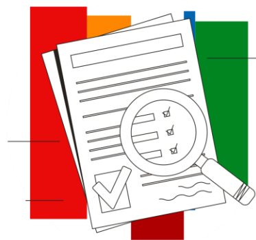
Hipoteczne listy zastawne

Ich zabezpieczeniem jest portfel kredytów hipotecznych. Warunki emisji określają częstotliwość i wysokość wypłaty odsetek, a także datę zwrotu kapitału