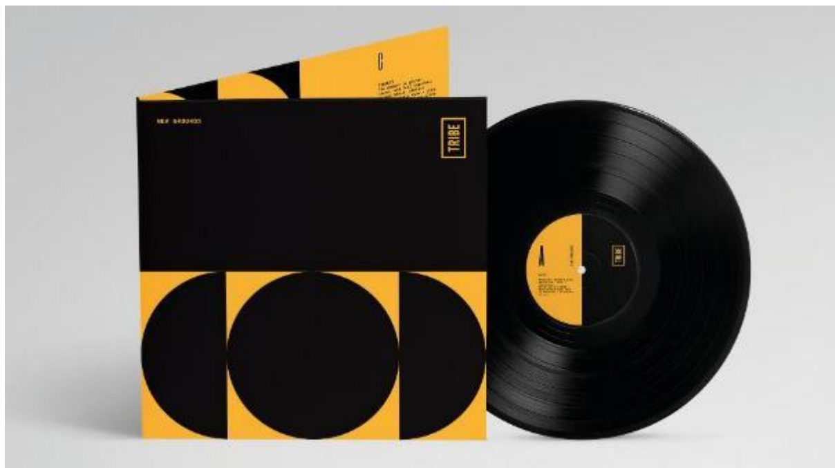
Winył NEW GROUNDS marki TRIBE

LIMITOWANA EDYCJA WINYLA, KTÓRY ODDAJE KLIMAT TRIBE I RYTM WSPÓŁCZESNEGO PODRÓŻOWANIA