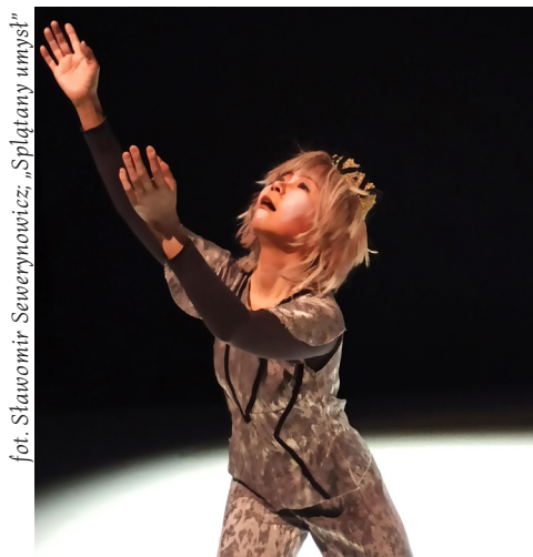
fot. Sławomir Sewerynowicz, „Splątany umysł”