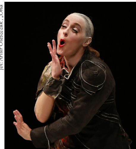
fot. Artur Oleszczuk, „Ond”