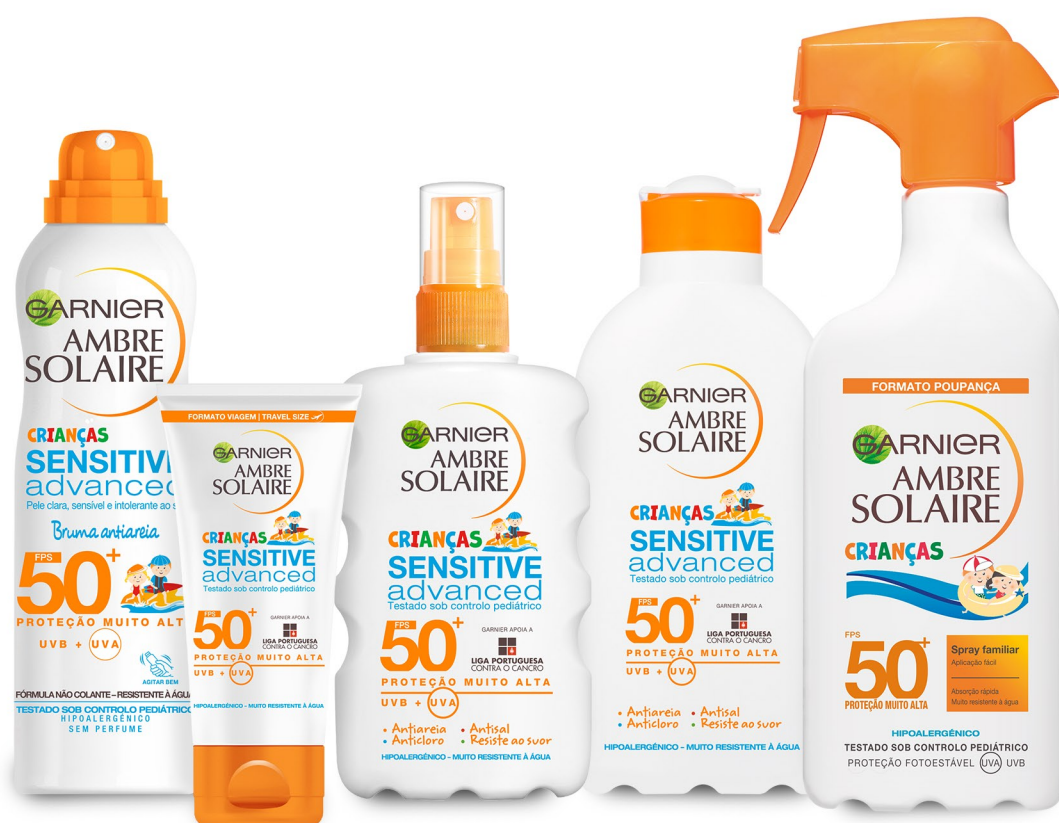
BRUMA ANTIAREIA SENSITIVE ADVANCED CRIANÇAS 200ML

Produtos que transformam a aplicação do protetor solar num momento divertido para os mais pequenos!