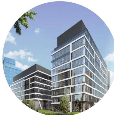
Gdański Business Centre II C HB Reavis