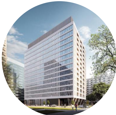
Atrium 2 Skanska Property Poland

*Strzałki wskazują kierunek zmiany wobec analogicznego okresu ubiegłego roku.