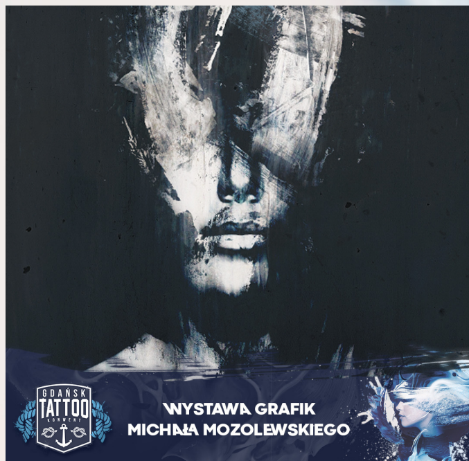
WYSTAWA GRAFIK MICHAŁ MOZOLEWSKIEGO