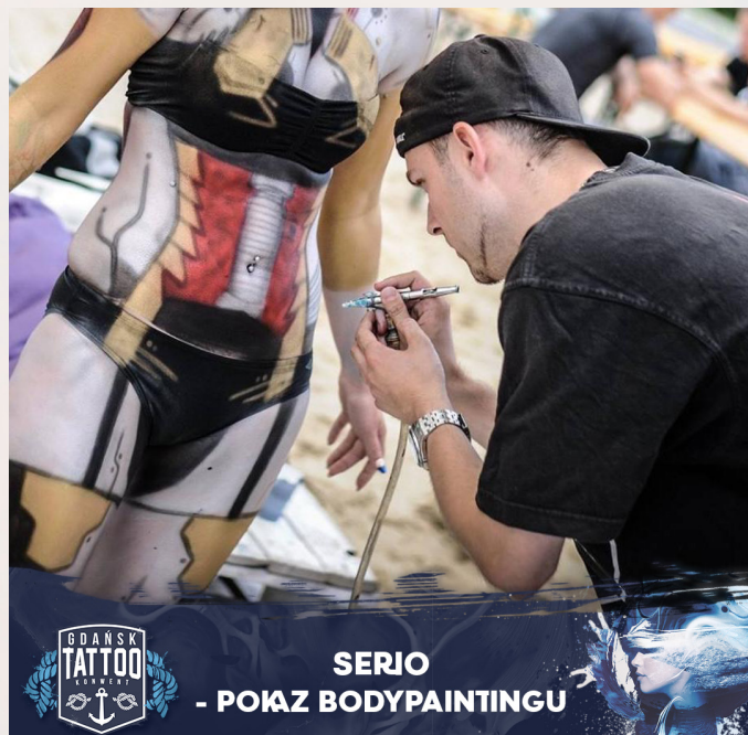
SERIO - POKAZ BODYPAINTINGU